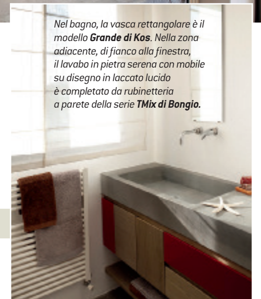
Nel bagno, la vasca rettangolare è il modello Grande di Kos . Nella zona adiacente, di fianco alla finestra, il lavabo in pietra serena con mobile su disegno in laccato lucido è completato da rubinetteria a parete della serie TMix di Bongio .